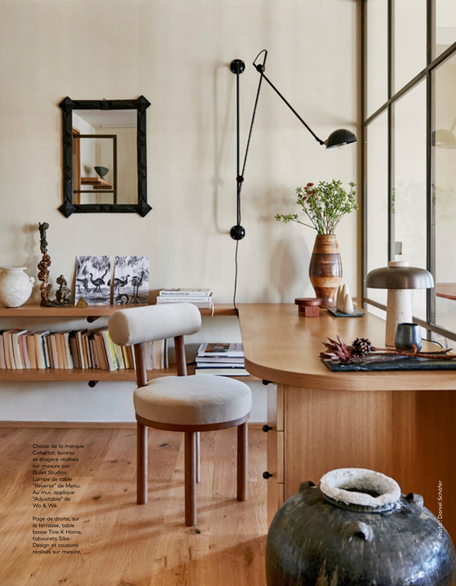
Chaise de la marque Collector, bureau et étagère réalisés sur mesure par Quiet Studios. Lampe de table "Reverse" de Menu. Au mur, applique "Adjustable" de Wo & Wé.