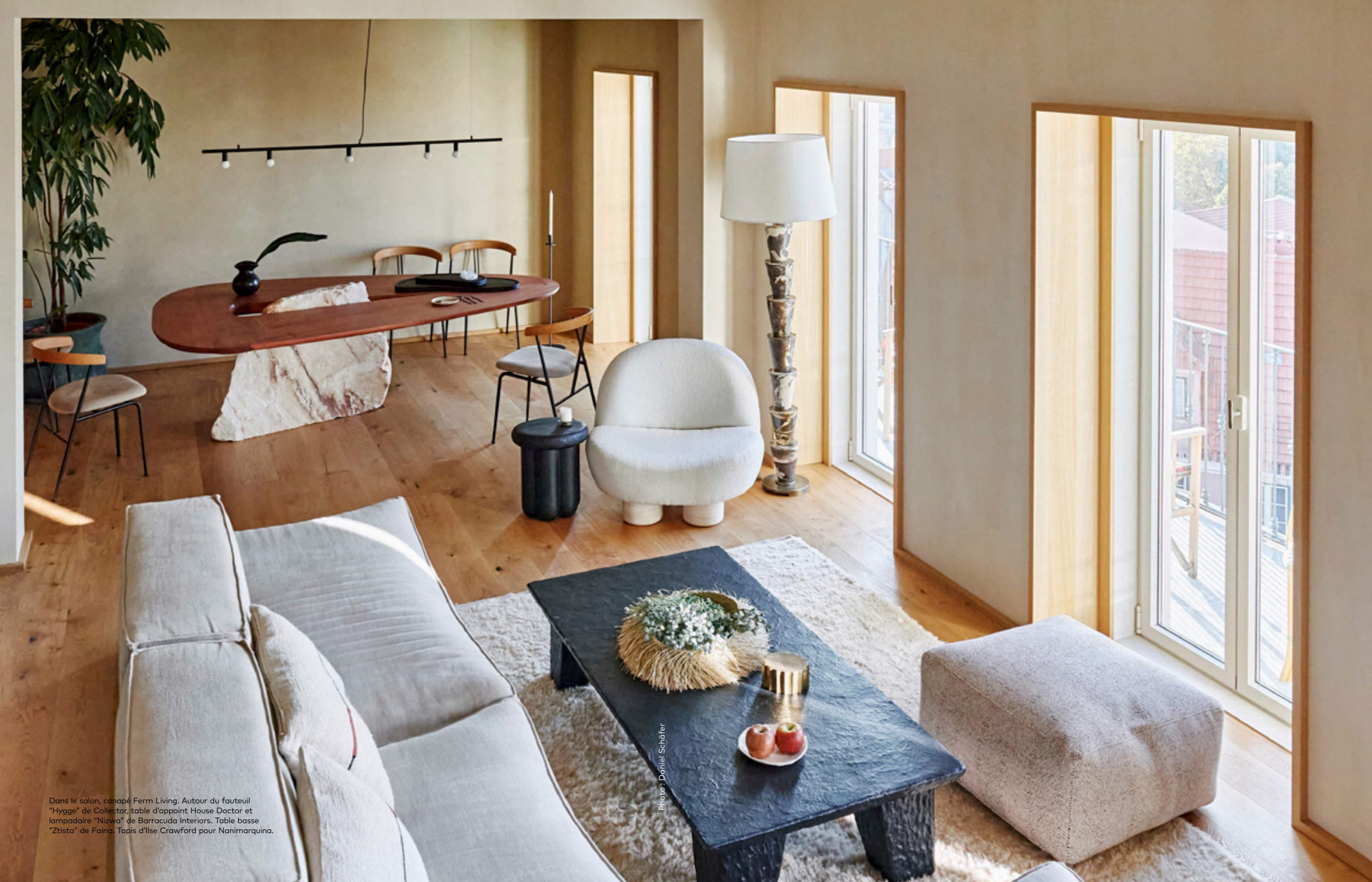
Dans le salon, canapé Ferm Living. Autour du fauteuil "Hygge" de Collector, table d'appoint House Doctor et lampadaire "Nizwa" de Barracuda Interiors. Table basse "Ztista" de Faina. Tapis d'Ilse Crawford pour Nanimarquina.